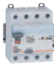
4 119 67

Caractéristiques techniques p. 548 Performance des différentiels p. 552