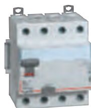
4 116 76