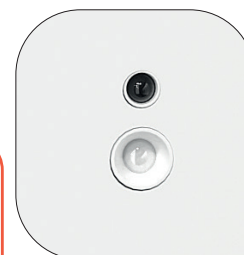
Système de détection combinant un capteur infrarouge (mouvement) et un capteur de luminosité