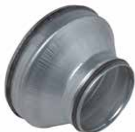
Réduction Conique Concentrique à joints